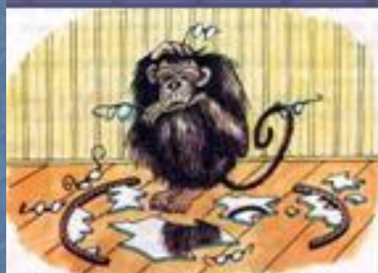
Мартышка и очки