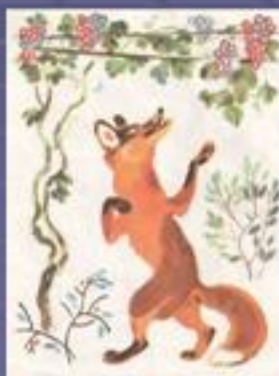
Лисица и виноград