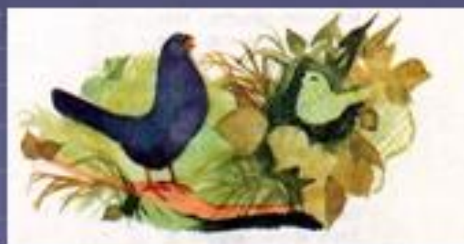
Чиж и Голубь