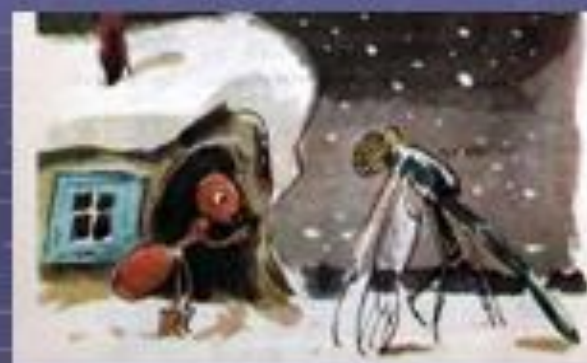
Стрекоза и Муравей