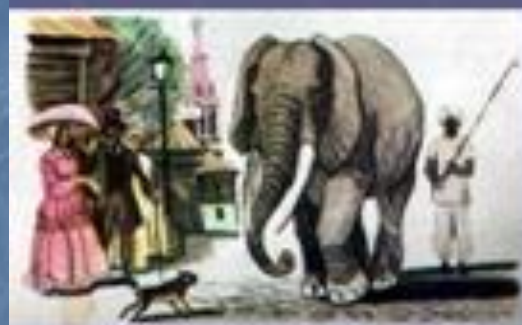
Слон и Моська