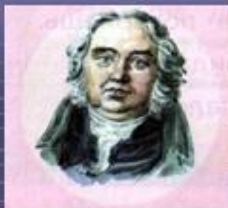
Иван Андреевич Крылов